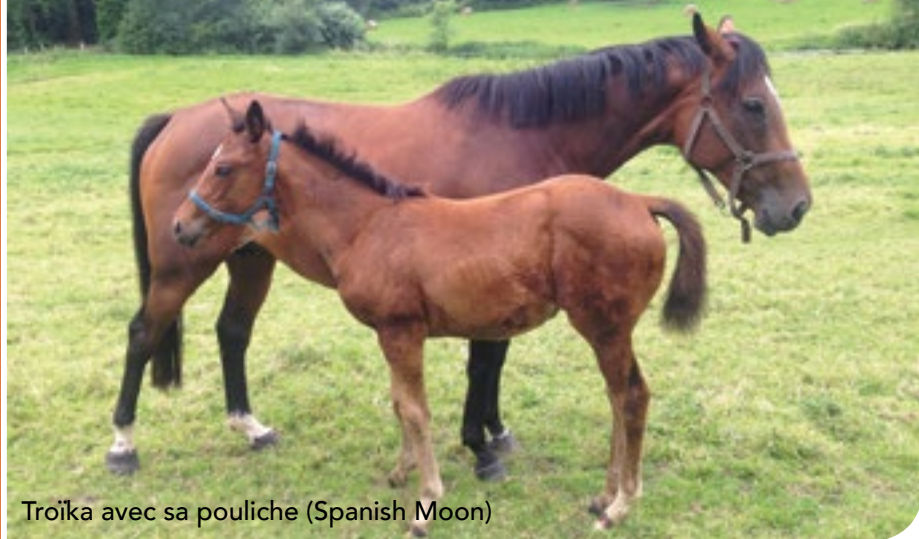
49 Troïka avec sa pouliche (Spanish Moon)