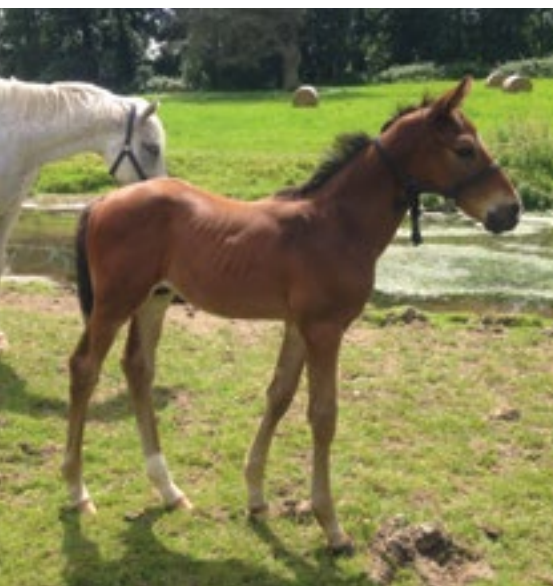
Ouchka avec son foal (Buck's Boum)

Installé en Anjou sur les 18 hectares de la propriété la plus part de la production est vendue au sevrage, ou louée à divers entraîneurs.