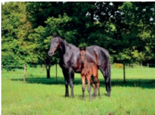
GLYCINE BLEUE (Le Nain Jaune) suitée de DÉFI BLEU (Saddler Maker)